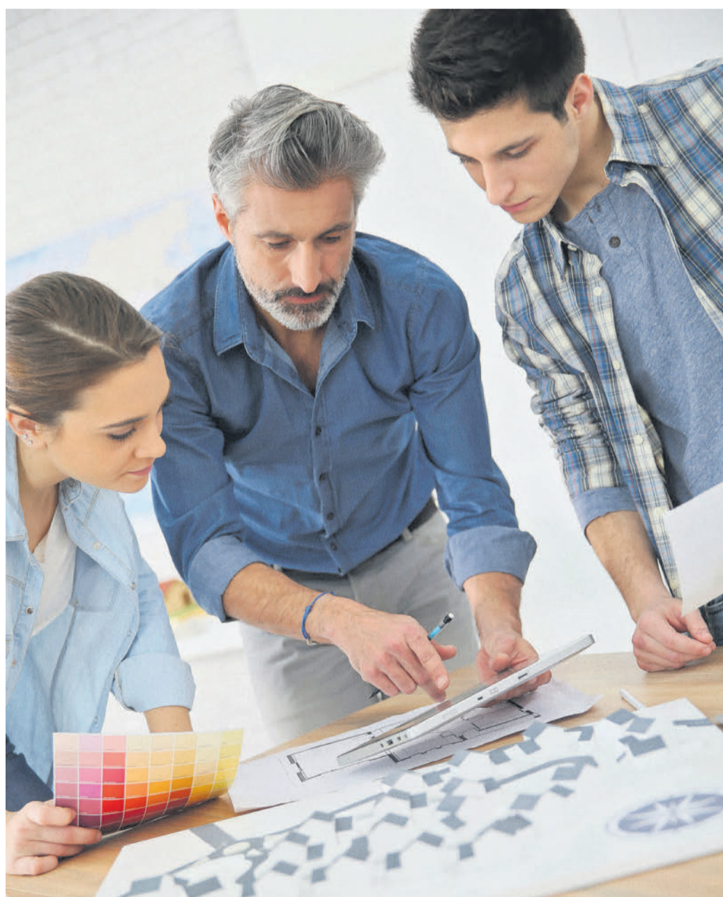
Der Lehrbetrieb hat für eine ordnungsgemäße Ausbildung zu sorgen.

Lehrberufsbilder: https://www.bmdw.gv.at/Nationale%20Marktstrategien/LehrberufeInOesterreich/ListeDerLehrberufe/Seiten/liste.aspx