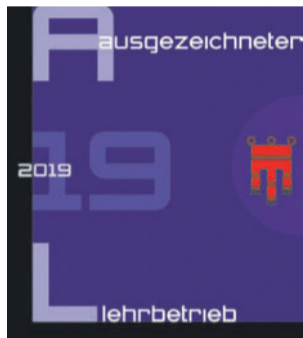
Haberkorn ist ein ausgezeichnete Lehrbetrieb.

Das Familienunternehmen mit Sitz in Wolfurt/ Vorarlberg wurde 1932 gegründet. Heute zählt Haberkorn mit über 1700 Mitarbeitern und über 30 Standorten in Österreich, Deutschland, Schweiz und Osteuropa zu den führenden technischen Händlern Europas.