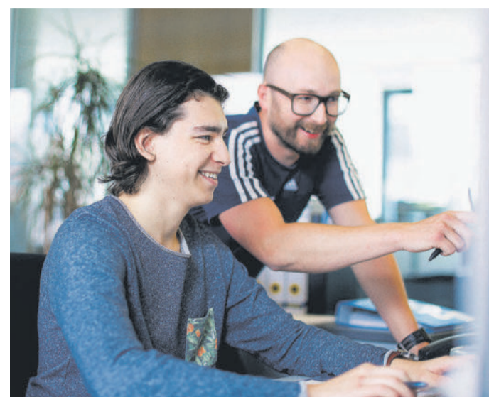
Neben den technischen Produkten spielt auch das Aneignen von kaufmännischem Wissen eine große Rolle.

Damit das Know-how der Lehrlingsausbildner und Mitarbeiter bei Haberkorn auch richtig an die Lehrlinge weitergegeben wird, hat sich die „Haberkorn-Rotationsausbildung“ etabliert. Dabei lernen die Lehrlinge in allen Lehrberufen im Laufe ihrer Ausbildung unterschiedliche Abteilungen wie zum Beispiel Einkauf, Vertrieb, den Abholmarkt und die Logistik kennen. Durch dieses Konzept erhalten sie die Möglichkeit, in den verschiedenen Bereichen des Unternehmens „live“ mitzuarbeiten und am Ende sämtliche Prozesse zu verstehen. Die Beschäftigung mit technischen