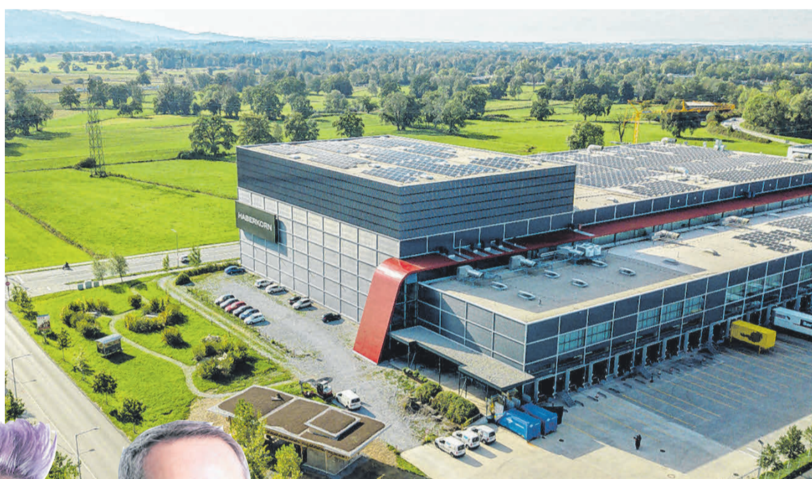
Der Hauptsitz von Haberkorn in Wolfurt.

mich nutzen und genieße diesen auch.“ Wenn der freie Tag auf den Freitag und in der Folgewoche auf den Montag falle, dann fühle es sich wie ein kleiner Urlaub an. „Das nutze ich auch für Kurzreisen.“ Die höhere Tagesarbeitszeit sei durch die gute Pausenregelung gut machbar. „Aus meiner Sicht gibt es